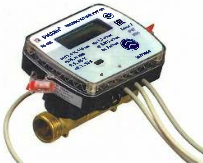
Рисунок 1 – Общий вид теплосчетчиков РУТ-01

Схема пломбировки от несанкционированного доступа представлена на рисунке 2.